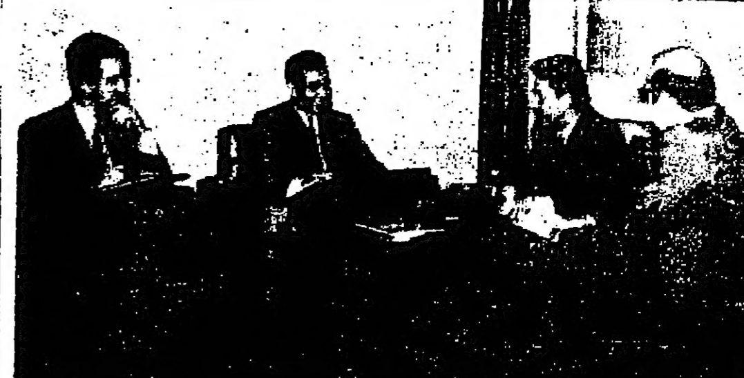
الوفد الصحفي المغربي بعثت الى السيد صلاح ابو زيد وزير الثقافة والاعلام لدى استقباله للوفد امس